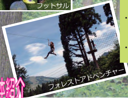
フォレストアドベンチャー